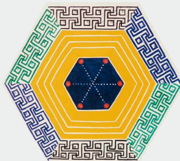
Sieglinde Bölz, Hexagon , 1989, Tusche, Computergrafik, Etempera auf Baumwolle, 105 x 120 cm

Le point commun entre la peinture de Sieglinde Bölz et Beate Knapp repose sur l'intensité des couleurs et la luminosité qui caractérisent leurs œuvres. La malfacture gestuelle propre aux deux artistes a évolué, en plusieurs décennies, en systèmes picturaux reliés de façon indépendante, jusqu'à devenir une richesse inhérente informelle et abstraite.